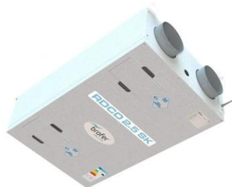
Anlæg / Aggregat